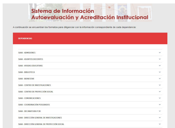
Imagen módulo Dependencias del SIAAI

Dicha herramienta permanecerá en actualización constante, con la certeza de que es un apoyo para la Comunidad Universitaria en los procesos del Aseguramiento de la Calidad Académica, encaminados hacia la gran meta de la “Acreditación Institucional”.