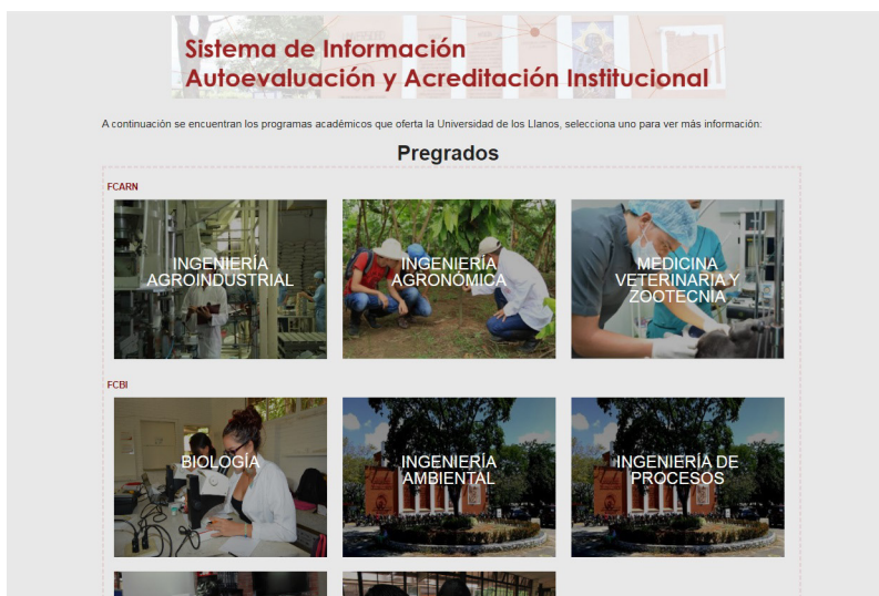
Imagen módulo Programas Académicos del SIAAI

A su vez, el SIAAI tiene el módulo “Dependencias”, en donde se encuentran los enlaces a los Informes Documentales que se nutren con información de la Institución para los procesos de autoevaluación de los programas académicos; para más información en cuanto a su ingreso y uso: