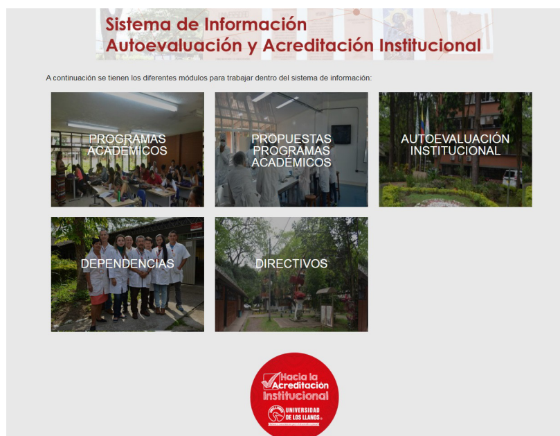
Imagen sección principal del SIAAI

http://acreditacion.unillanos.edu.co/index.php/informacion/siaai